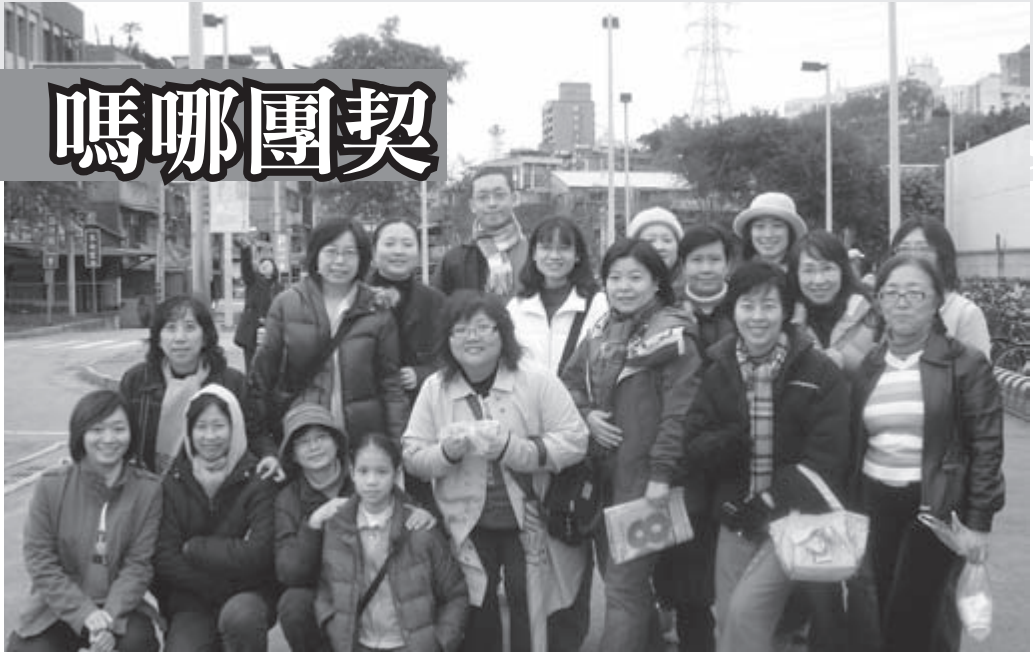
▲嗎哪團契-八里左岸走走