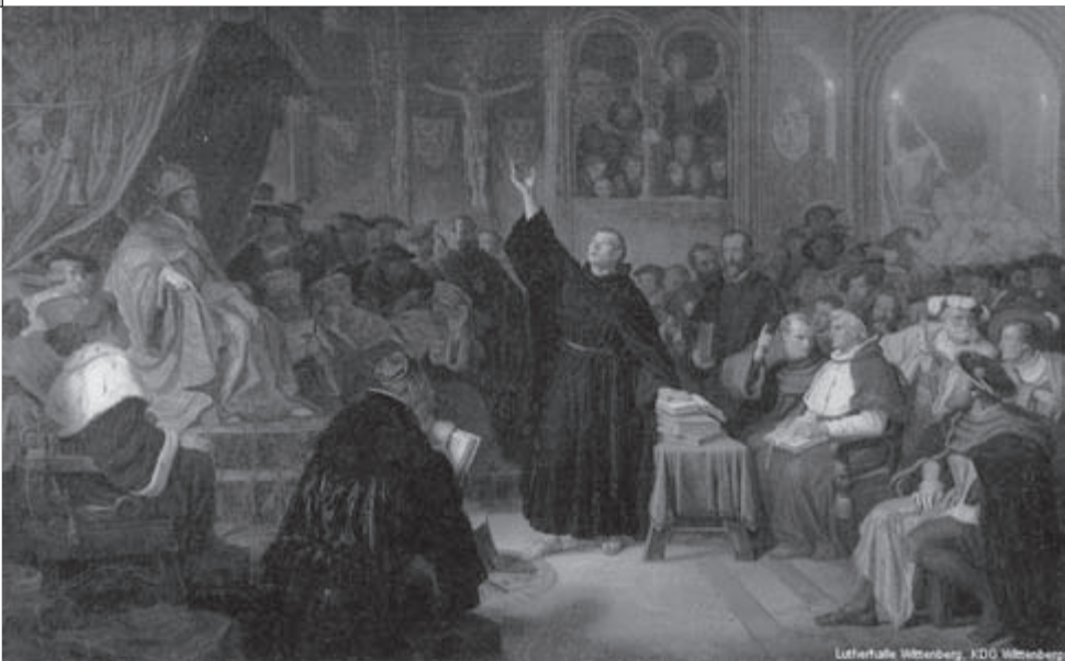
▲馬丁路德表明他的立場 Here I Stand.

音樂家，像是巴赫為了宗教改革紀念日所創作「第八十號清唱劇-堅固保障」（J.S. Bach 1685—1750 Cantata no.80 Ein feste burg）與孟德爾頌為新教教義創立三百週年所寫「宗教改革交響曲」（Mendelssohn 1778—1862 Symphony No.5 “Reformation”）等，都以馬丁路德的詩歌為主題創作。