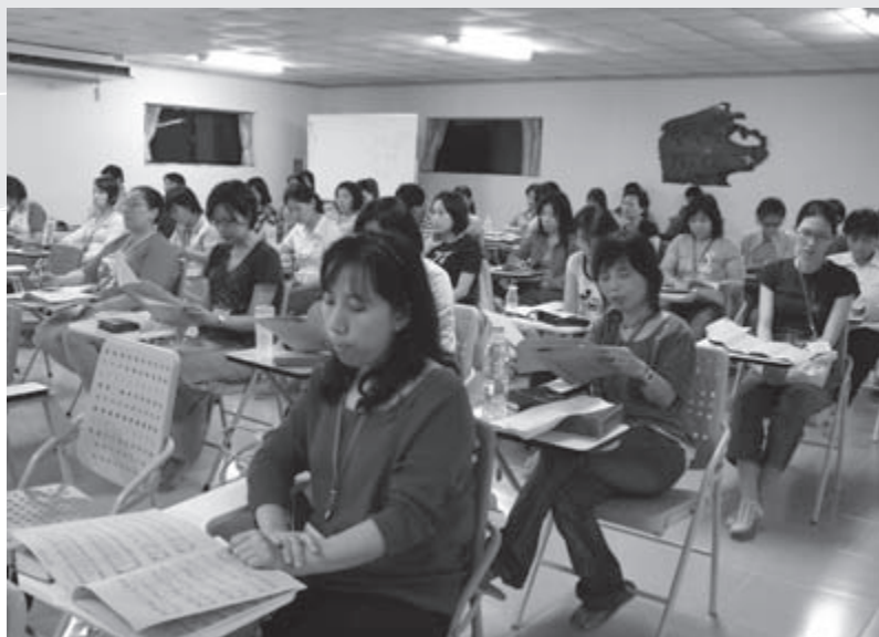
◀ 嗎哪退修會！專業與事奉