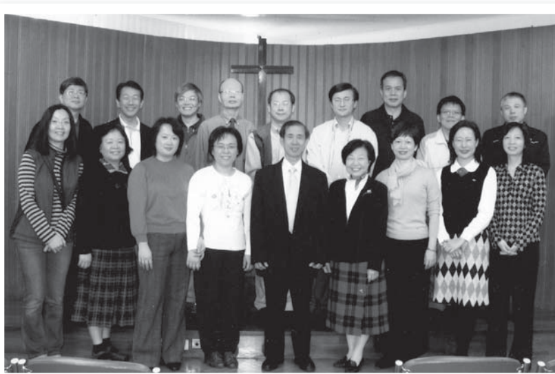
新朋友跟進同工最早開始時的三組組長合照