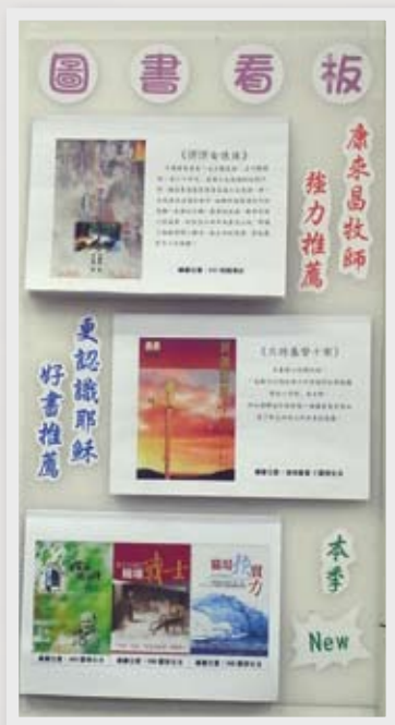
◀ 圖書看板定期更新牧者推薦的優質屬靈書籍，歡迎會友借閱。

校園讀經生活化系列叢書的介紹文章曾提醒我——在現今社會中，我想被什麼影響？是電視？世界的潮流？還是眾多好牧者、好神學家？