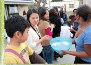
16 祖魯教會牧長給我們一個正式的歡迎會，飯前要排隊先洗手(同一盆水)