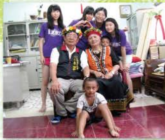
▲ 與大南教會的牧師合影