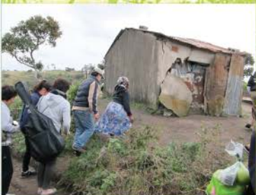
4 探訪~小路幾經曲折來到老媽媽ugogo搖晃欲墜的家