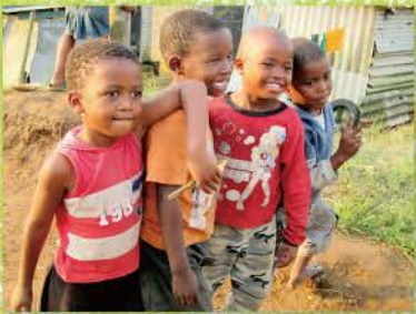
10 探訪途中，鮮少看見外人的兒童露出好奇又熱情的笑容