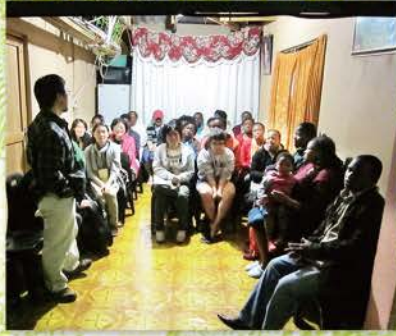
29 家庭小組在Mam Manqeled家聚會