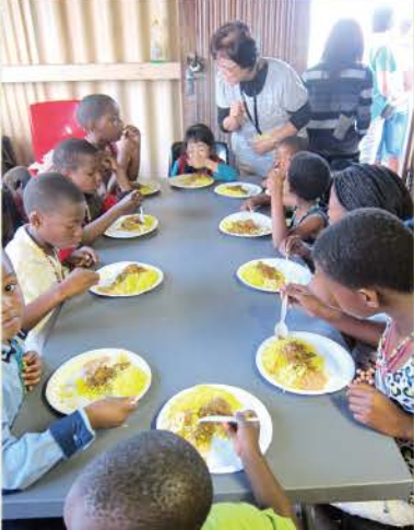
22 午餐囉！藉機教導餐前洗手、餐後清潔整理的好習慣