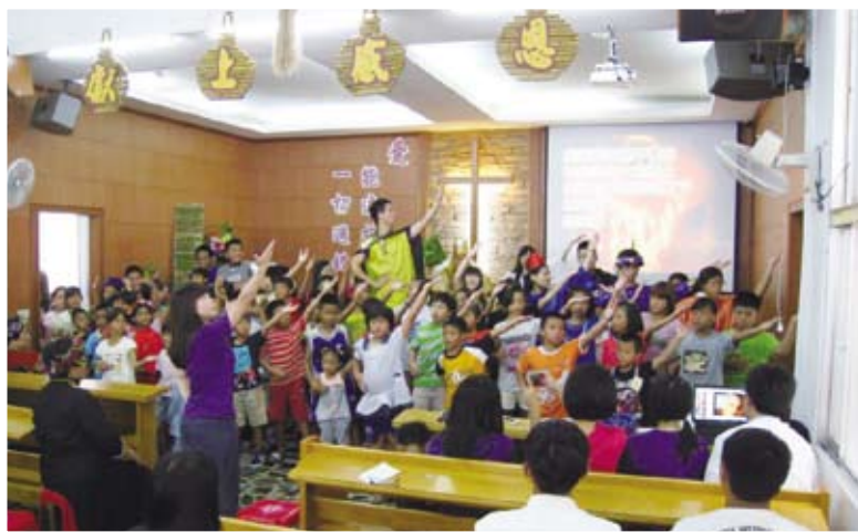
▲ 成果展所有小朋友上台演出