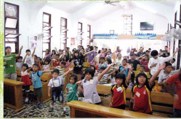
▲ 帶動唱小孩子們投入的模樣