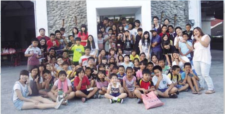
▲ 與所有小朋友大合照

力來愛你，所做仍是不完全。把你完全的交託給天父，是我最美好的祝福。當你向天父禱告的時候，要記得你也在我心裡。」《祝福》這首詩歌的歌詞已然說明了我們每個人的心情，讓眼淚化為最溫暖的祝福。