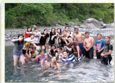
▲ 到溪邊玩水大合照