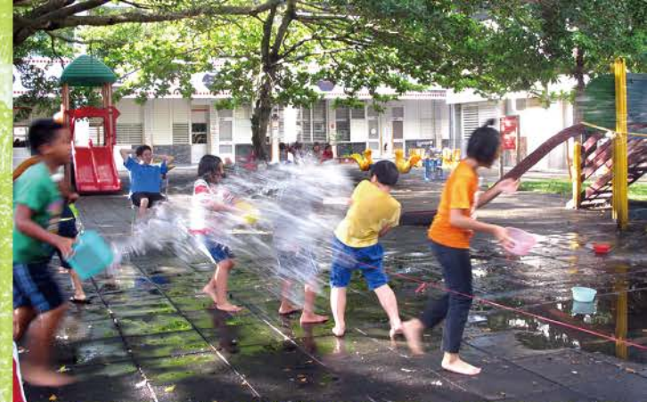
▲ 體能課孩子們旺盛的體力永遠用不完