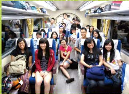
▲ 6小時的火車旅程，我們出發了！