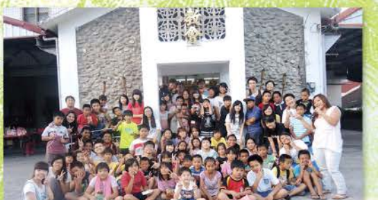
▶ 與所有孩子們大合照