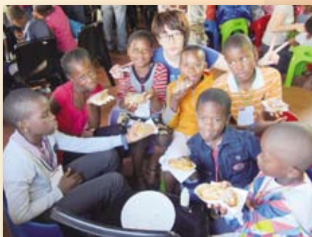
▲ 點心DIY — 提醒種子撒在好土的聖經信息

短宣需要以英文跟當地同工溝通，同工再翻譯為祖魯語給營會的小朋友或不諳英文的會眾聽；感謝主，其他英文能力好的隊員體貼我的軟弱，多承擔需要英文能力的服事，如聖經課程、金句背誦。從中我的外語是服事必需的能力，但不能將它視為一個不可能超越的障礙，否則會容易輕忽了上