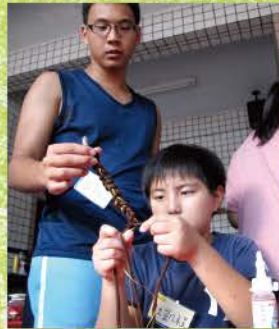
▲ 手工課孩子們認真的模樣