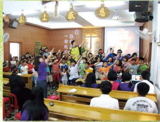
▲ 成果展所有小朋友上台演出