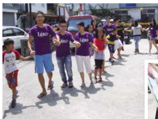
▲ 與大南教會的弟兄姊妹手牽手唱歌讚美 聖經回應課認真的參與 ▶