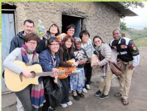
5 老媽媽ugogo很高興我們去探訪她，教會正在為她募款蓋新房子