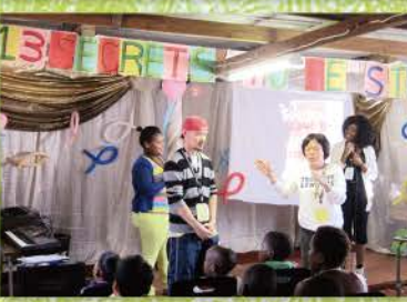
18 每天精心設計的前導戲，引發孩子的興趣