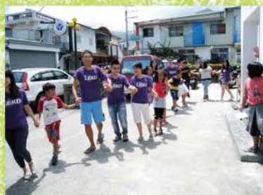
◀ 與大南教會的弟兄姊妹手牽手唱歌讚美