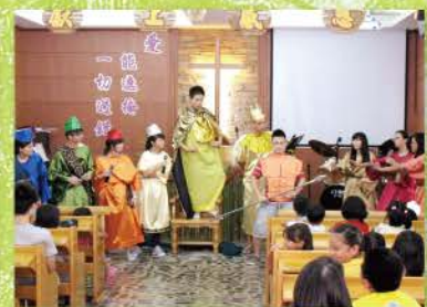
▲ 第一天的戲劇時間