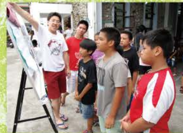
▲ 聖經回應課認真的參與