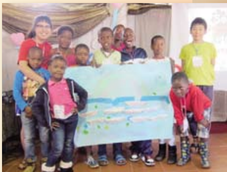
▲ We are the team, 看我們的共同創。