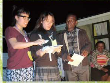
17 辛苦準備小抄做見證，太暗看不見……還好有手機手電筒