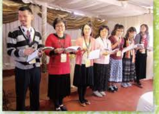
14 主日崇拜前練習獻詩