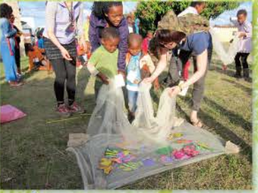
26 體驗彼得與其他門徒下網打魚，真的很不容易呢