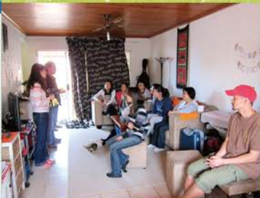
1 一到德班育靖宣教師和師母給我們一個正式的歡迎和orientation