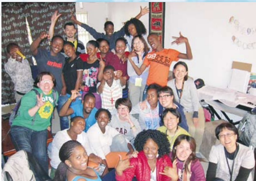
▲ 與青年團契一起烤肉、遊戲、見證，我們已經沒有膚色之分了。