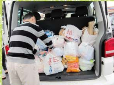
3 短宣，首先要能生活，接下來十多天的早餐一次要買足