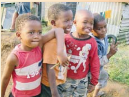
▲ 鮮少看見外人的兒童露出好奇又熱情的笑容