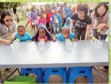
25 兒童營的outdoor game激起大家的榮譽感，玩起來超拼命的