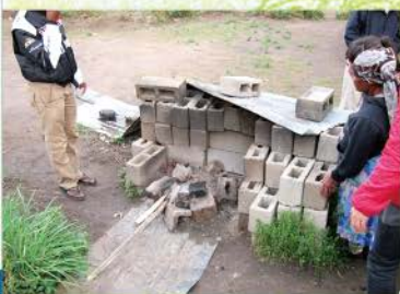
8 這是老媽媽ugogo的戶外廚房