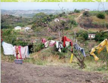
6 因為水要從遠處挑來，不常洗澡，好不容易洗個衣服就這樣晾吧