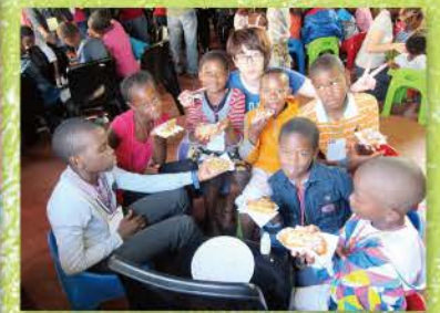
24 點心DIY—蛋糕放入堅果撒上小花裝飾，提醒種子撒在好土的聖經信息