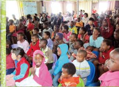
28 主日成果展，大家都聚精神呢