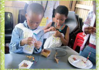
20 兒童營會Craft—串珠十字架項鍊，我可以自己來