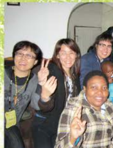
7 探訪Mam kiti家時祖魯食物