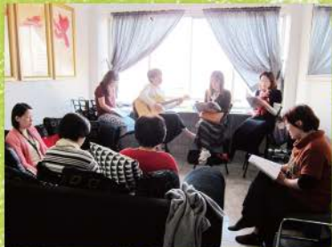
2 晨更為每日揭開序幕