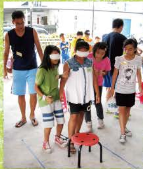
▲ 聖經回應課的遊戲時間