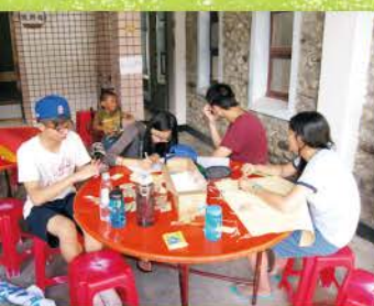
▲ 到了當地開始做名牌