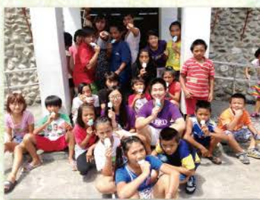
▲ 和孩子們一起吃冰