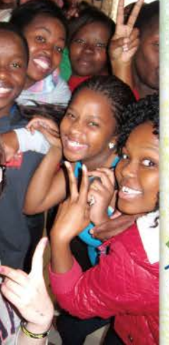
13 經過幾天的相處與青年們建立了好情誼