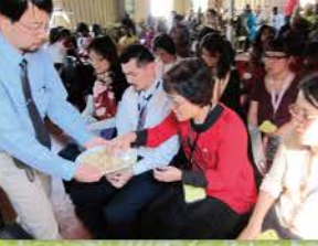
15 與當地弟兄姊妹一同領聖餐倍感親切