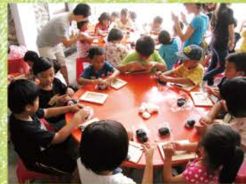
▲ 手工課的相框製作