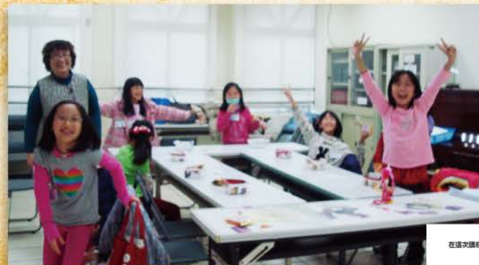
耶！我們成功逃出耶利哥、過約旦河、攻耶利哥城、攻艾城、打敗五王聯軍得到最高分了！！