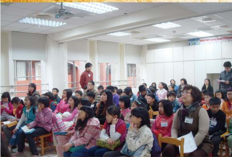
▲ 讀經營開始囉！開會禮拜大家都專心聽。