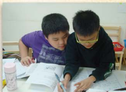
▲ 借我看一下你的答案