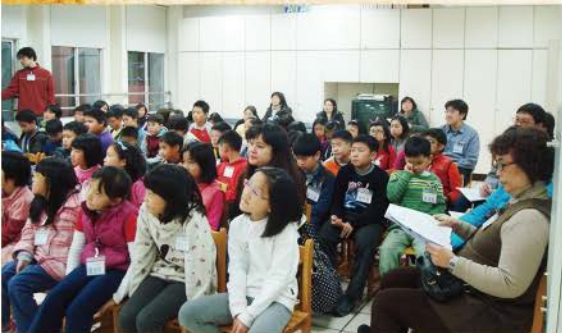
▲ 聽康牧師講解約書亞記並解答我的問題，讓我很滿足。