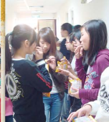
休息一下補充體力。