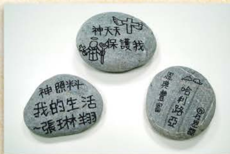
以色列人立石為記，我也在石頭上寫下神的恩典以茲記念。