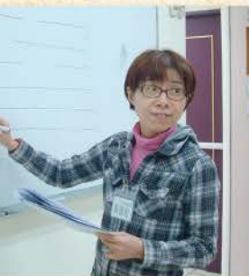
是沒有目的，回答問題可以得點數喔！