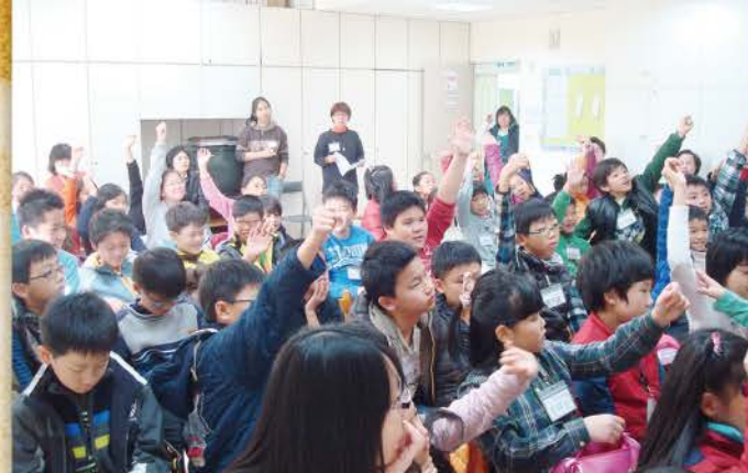
複習時間到了，又是加分得點數的時候。