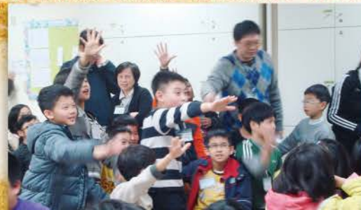
1、2、3、4、5、6、7、8拍賣會開始了，所有的點數變成現金，趕快出價，這個東西我要，我出5千……。