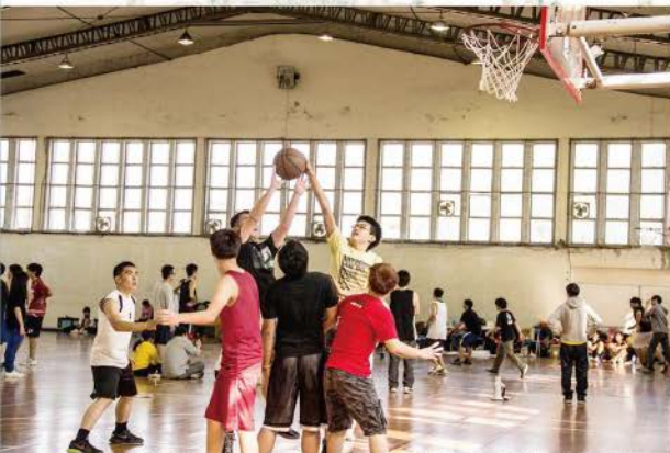
▲ 籃球競賽，你投我攔，提倫傳道奮力一投