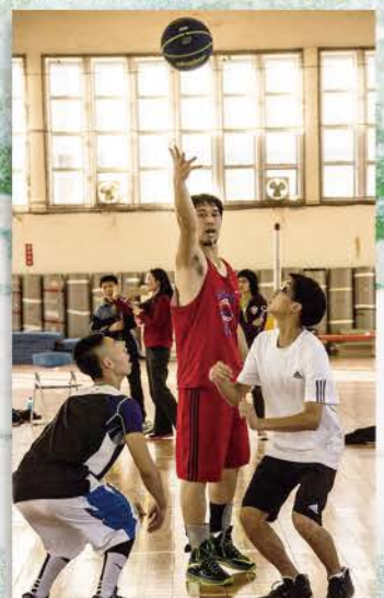
▲ 籃球明星賽，開球瞬間，球員眼盯籃球，為的是搶到優先的權利