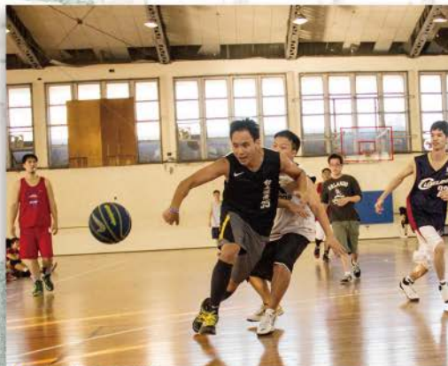
▲ 籃球明星賽，球一落地，眾人紛紛去搶奪球，以掌握比賽