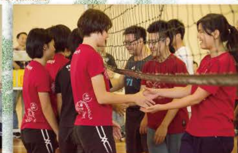
排球競賽，比賽結束，雙方握手以表示對对手的敬意。▲