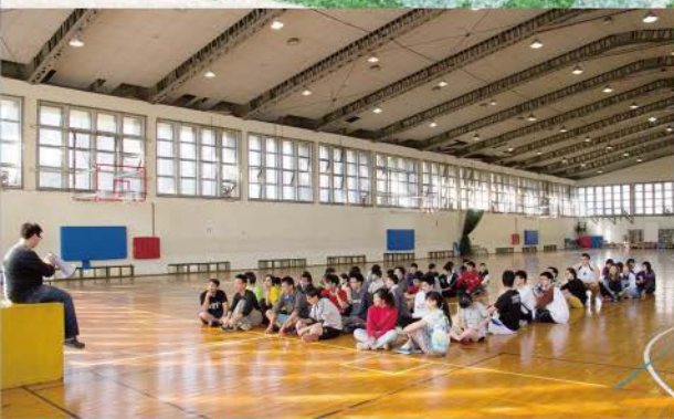
▲ 一大早，運動員們集合，開始準備參加運動會