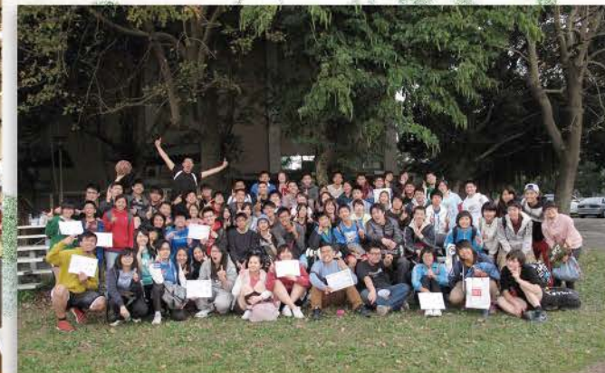
▲ 信友運動會，就在有趣的頒獎典禮後，完美的結束