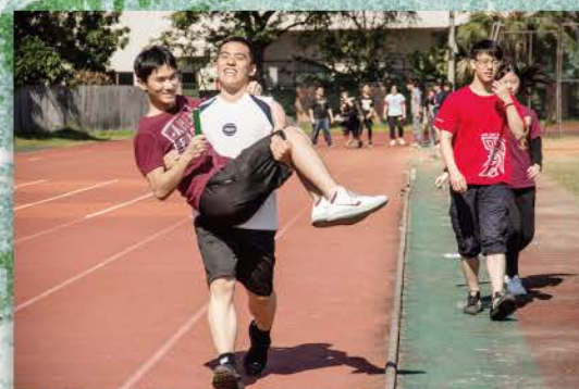
▲ 大隊接力，為了完成任務條件，運動員使勁抱起自己的隊友