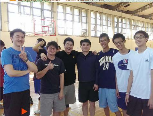
▲ 籃球比賽，仇儂團契和青少團契的契友比賽後，增進彼此的認識