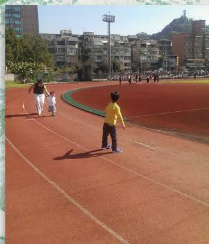
▲ 大隊接力，親子時間，爸爸帶小孩，完成這條100公尺的艱難道路