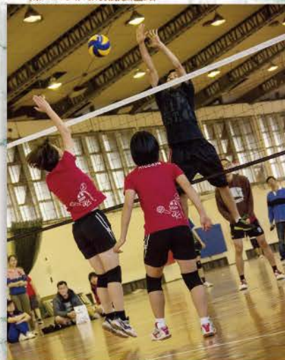
▲ 排球競賽，為了攔網，奮力一跳