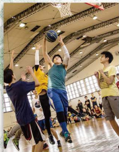
▲ 籃球比賽，球員奮力一跳，使盡全身力氣來將球放入籃框