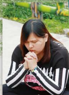
▲ 行走禱告小組分享2