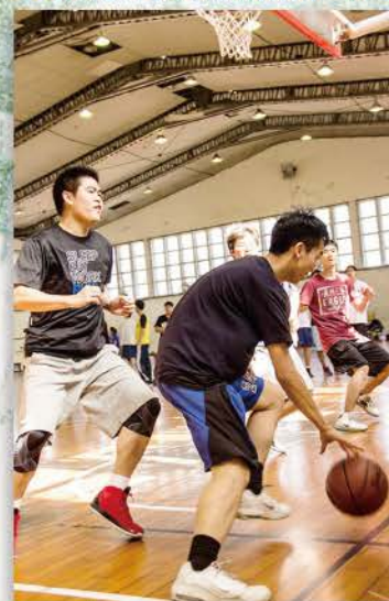
▲ 籃球比賽，籃下運球，為的是尋找空檔的機會