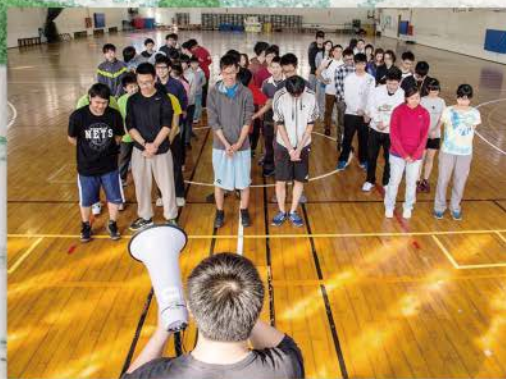
▲ 運動會開始，眾人以禱告來開始這次的運動會