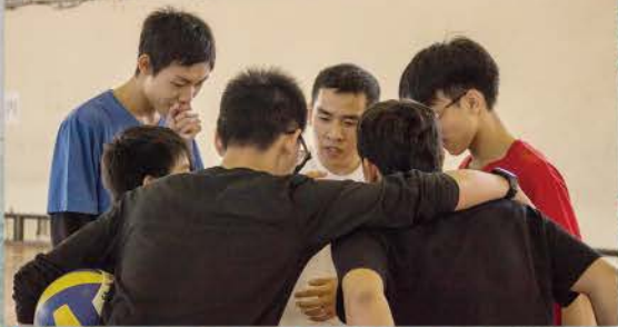
▲ 趣味競賽，橄欖球戰術討論，討論如何攻入敵營