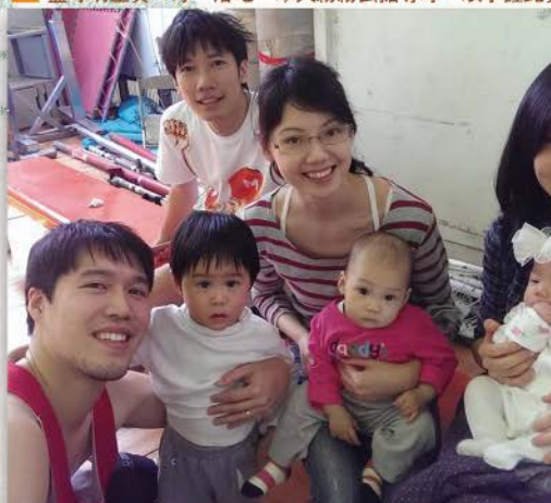
▲ 仇儂團契的契友們，在運動會中，有家人的支持和鼓勵