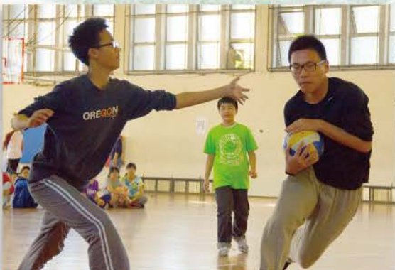
▲ 趣味競賽，橄欖球比賽中，球員為了避免被抓，一個MOVE閃躲攻擊球員