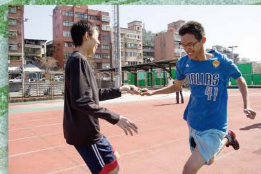
▲ 大隊接力，奮力一傳，傳接力棒給自己的隊友