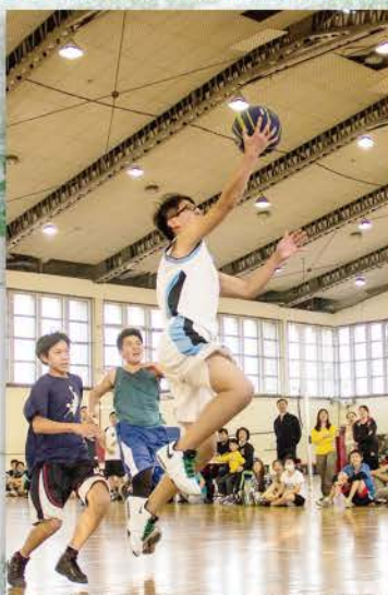
▲ 籃球比賽，球員標準的三步上籃打破比賽僵局