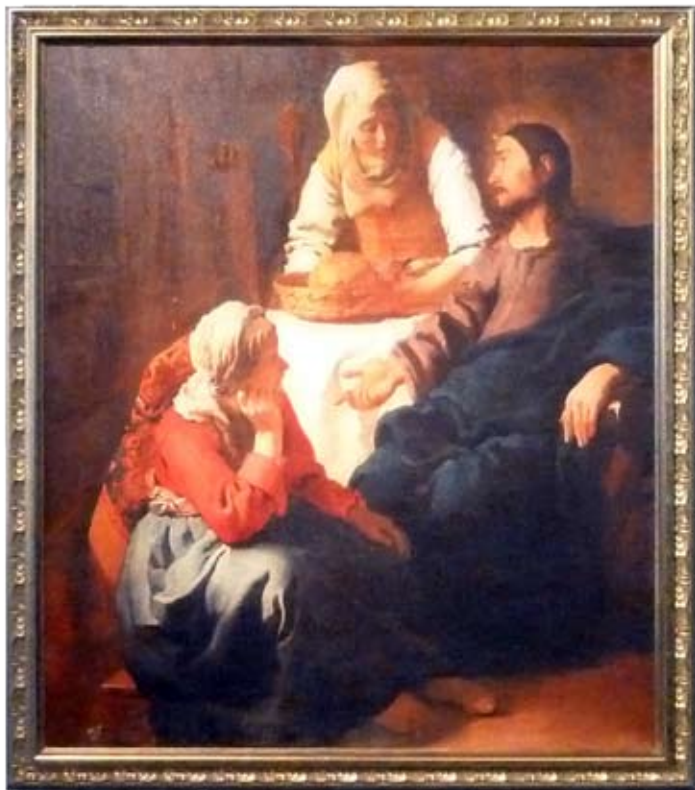
維梅爾(Johannes Vermeer)畫作： 以聖經故事為題材的作品--耶穌在馬大和馬利亞家中