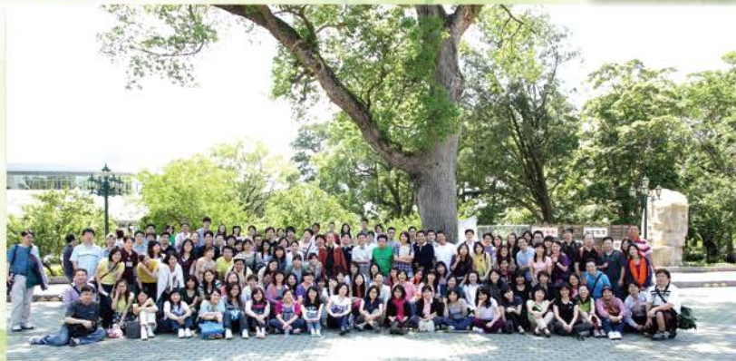
▲ 2011年團契退修會 (桃園復興青年活動中心)