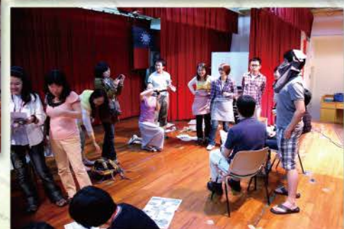
◀ 2011 退修會 大地遊戲 (復興青年 活動中心)