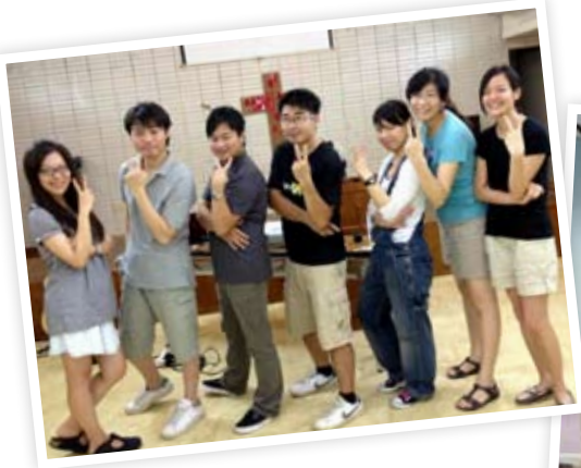
▲ 2012年福音營團隊同工合影 ▶ 契友平方團契慶生會