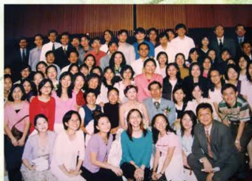
▲ 2001 契友婚禮