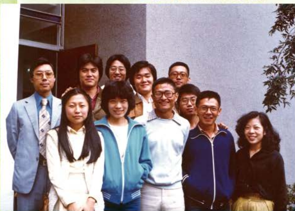
◀ 團契初期的麻雀小組1