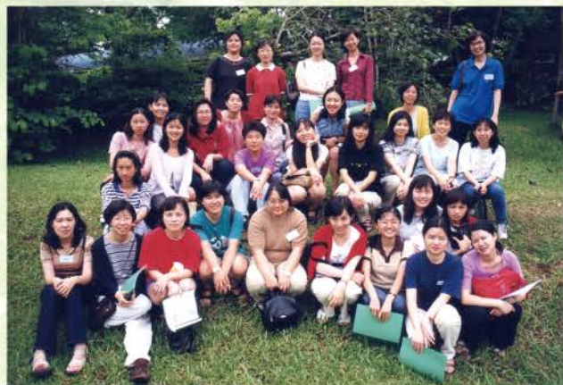
▲ 1999年團契退修會小組