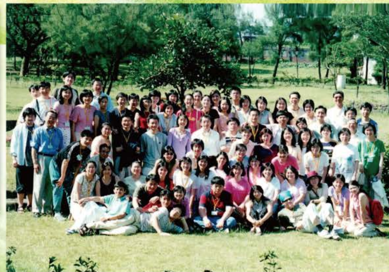
▲ 2001年團契退修會(金山青年活動中心)