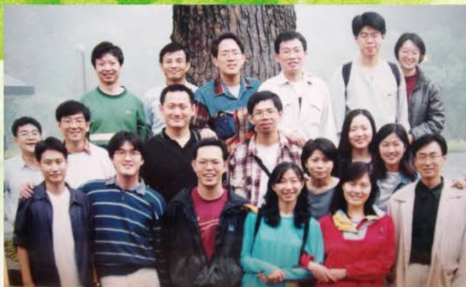
▲ 2000年團契退修會小組 (復興青年活動中心)