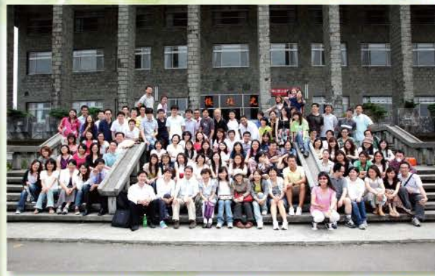
▲ 2010年團契退修會(金山青年活動中心)