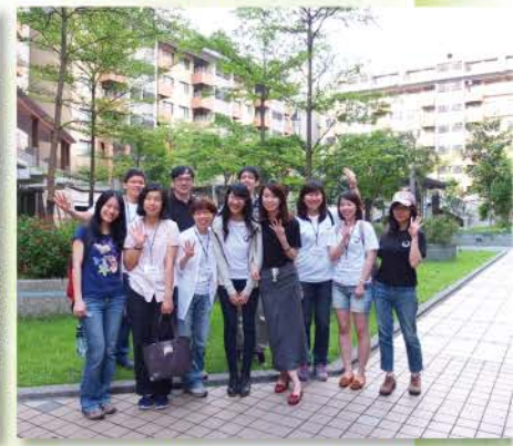
▲ 2014年團契退修會小組(林口長庚養生文化村)