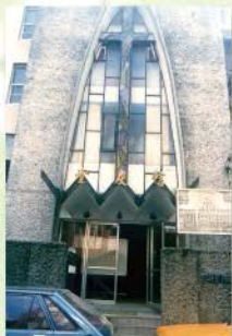
▲ 團契初期在教會舊堂副堂聚會 (現今的車庫)

過去四十年來，神使用信友團契，造就許多人成為祂的器皿。教會中許多忠心委身的事奉同工、執事甚至長老與傳道人，都曾經在信友團契中蒙神培養和預備。