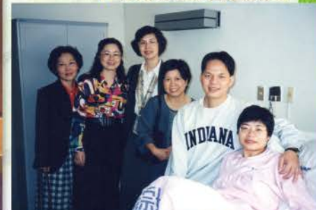
▼ 1998輔導探望產後契友