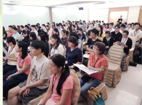
▲ 2013年團契退修會(東森山莊)