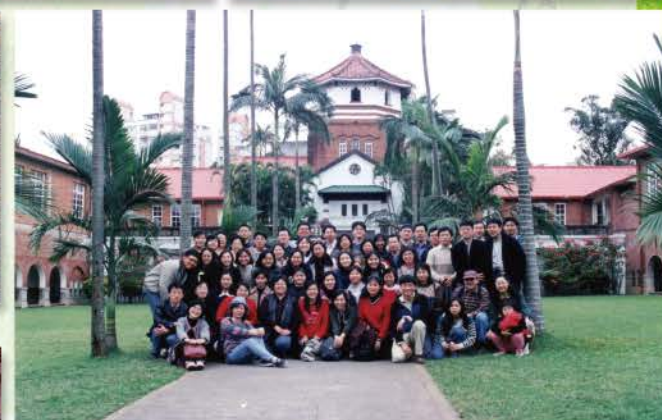
▲ 1999團契 出遊(淡水)