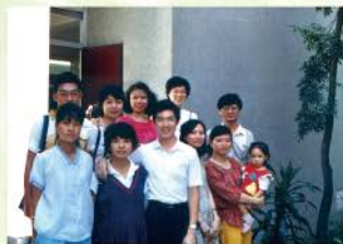
▲ 團契初期的麻雀小組2