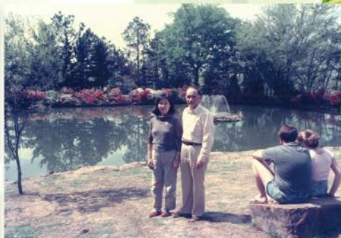
▲ 團契初期輔導冠順舉牧師伉儷