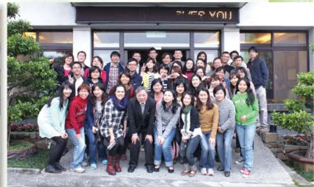
▲ 2013年輔導同工退修會(宜蘭大衛之星)