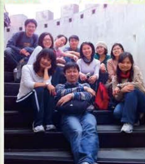
▲ 2011同工出遊(草嶺古道)