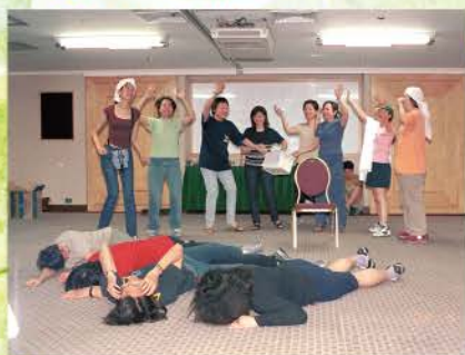
◀ 2002 退修會的 戲劇演出