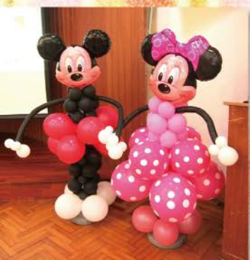
▲ 米奇米妮也來參加營會