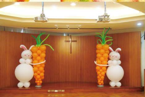
▲ 小白兔和紅蘿蔔歡迎小朋友