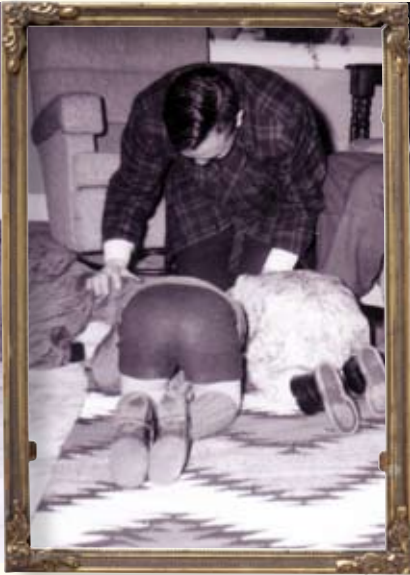
與父親一起跪禱。 在他的禱告冊子裡， 記滿了他每天為我們三兄妹的禱告。