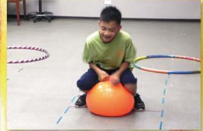
▲ 嘉年華會之騎跳跳馬