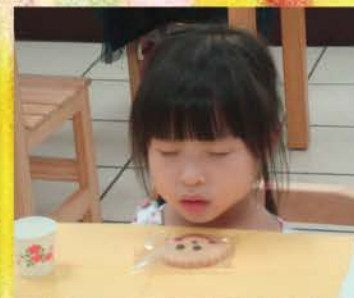
▲ 感謝天父賜好吃點心