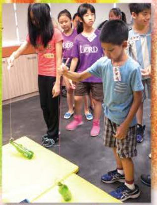
▲ 嘉年華會之釣酒瓶