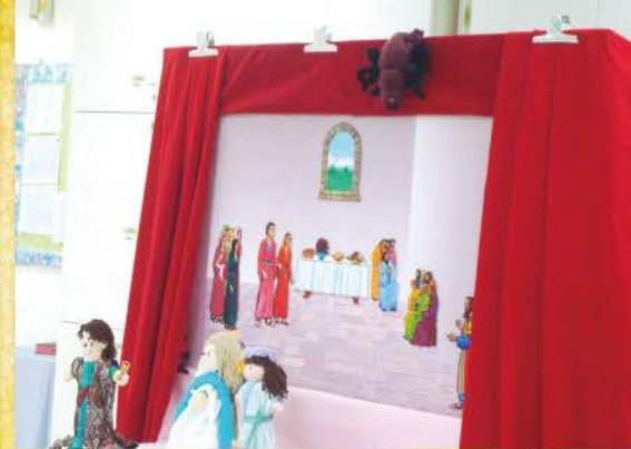
▲ 小朋友最愛的角色——小蜘蛛