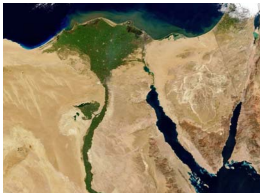
埃及分明的地理環境，尼羅河谷是綠的，之外一片黃沙