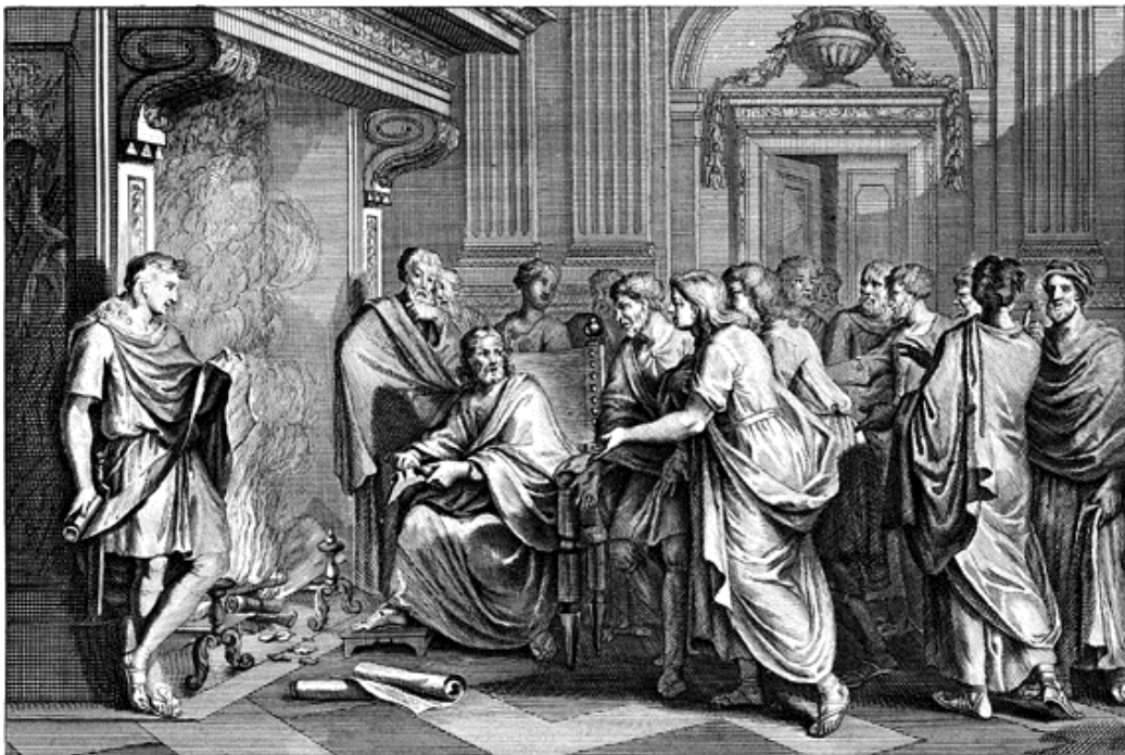
約雅敬王割裂耶利米的書卷，扔在火盆中焚燒