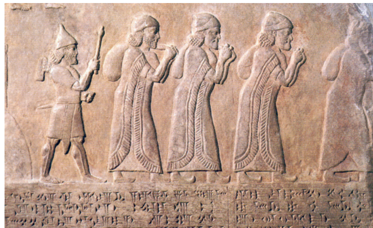
猶太人被擄流亡至巴比倫