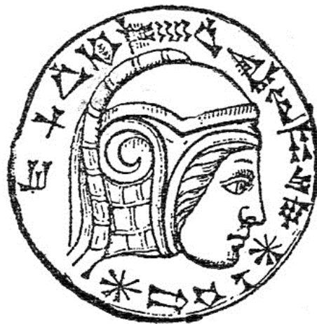
尼布甲尼撒的頭像