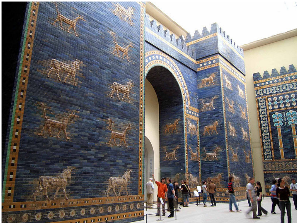
在柏林 Pergamon 博物館重建的巴比倫城 Ishtar 門