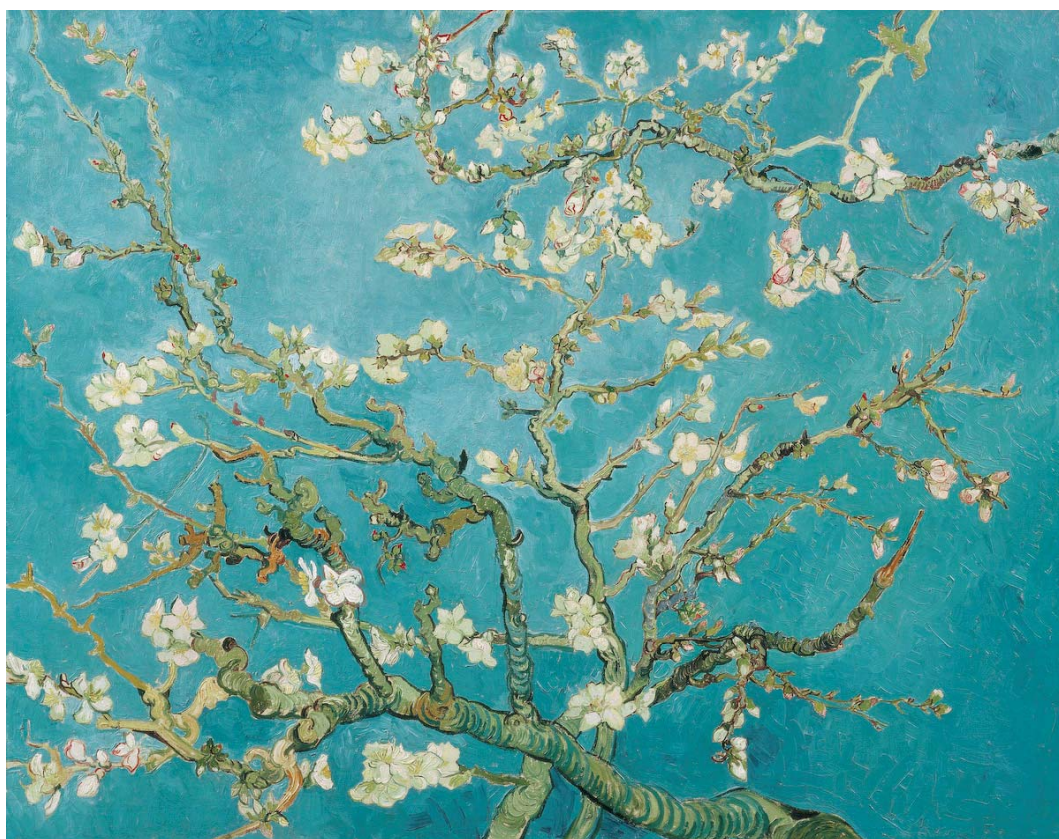
Van Gogh 的杏樹花