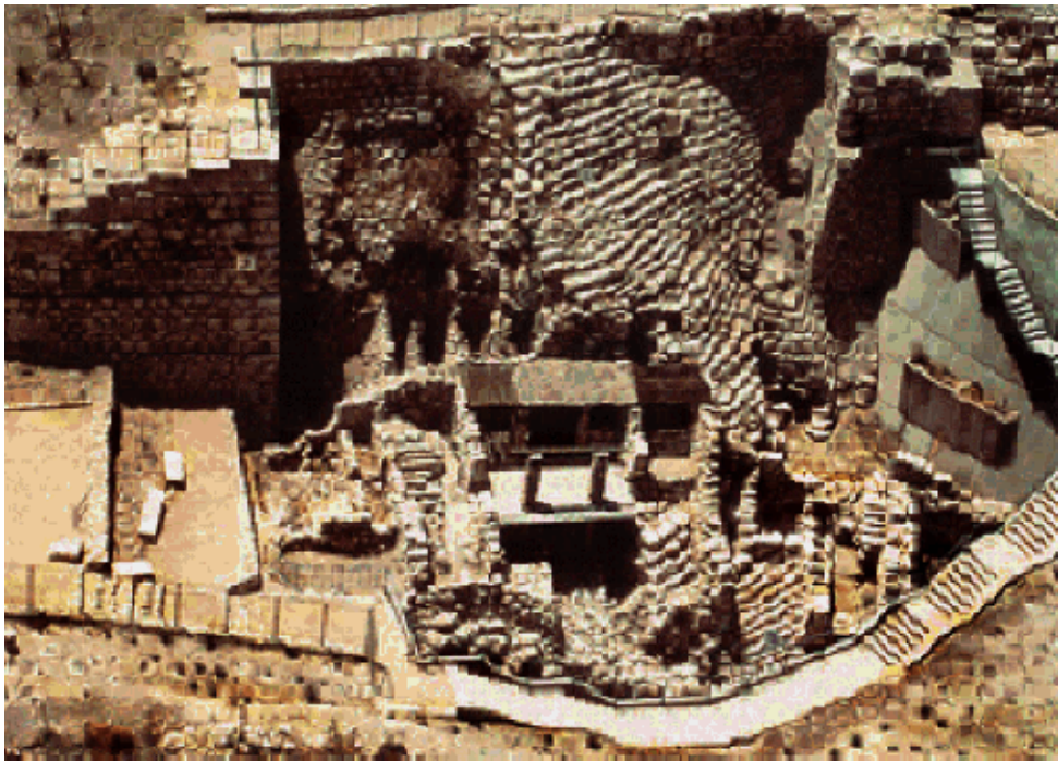
考古挖掘出來的被擄前的耶路撒冷城遺跡