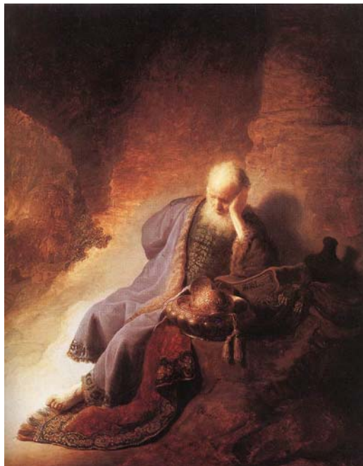
倫布蘭所繪的耶利米為耶路撒冷哀哭