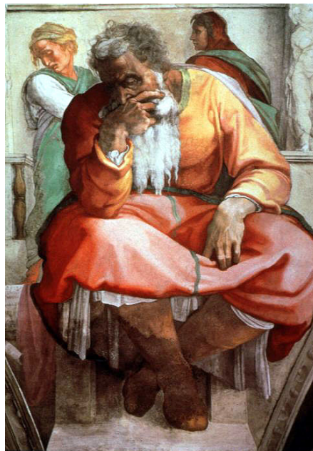
米開蘭基羅在西斯汀教堂壁畫中的耶利米像