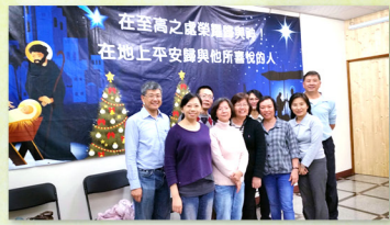
▲ 內湖堂由馬牧師帶隊，在街頭佈道邀請