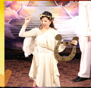
▲ 小天使述說神的愛是何等的愛：神決定要讓祂的兒子，為眾人的罪死在十字架上，叫世人因祂得救，解決人類想作老大的問題