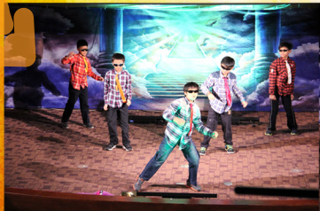
▶ ▶ 什麼動作？為什麼呢？因為世人都想當老大，把世界搞的亂糟糟