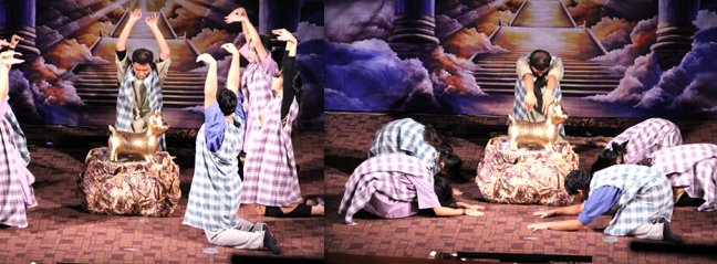
▶ ▲ 以色列人要求亞倫造金牛犢、他們拜金牛犢惹動神的怒氣