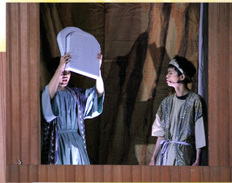
▶ ▲ 摩西怒摔法版