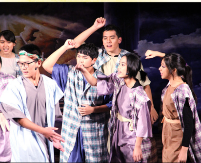
▶ ▲ 以色列人忘了神頒給他們的完美十誡