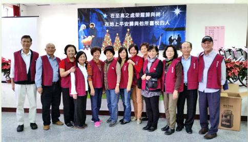
▲ 恩典團契參與街頭佈道