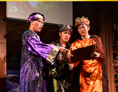
▶ 神要以嬰兒的身份降臨人間，實現以賽亞的預言，眾天使紛紛去報告這大好的信息給約瑟、馬利亞、牧羊人、博士