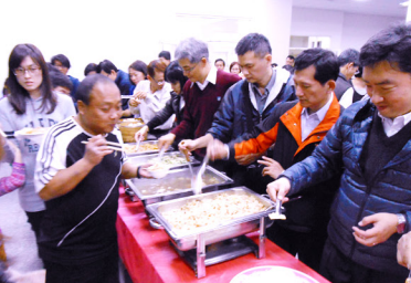
▶ 活水們忘了自己的飢餓，歡欣的為人打菜