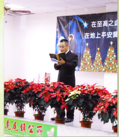
▲ 義捉傳道以台語漢字版經文：路二8-14宣召