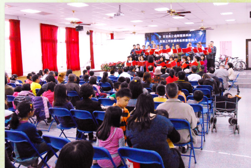
▲ 會前詩班的走位預備