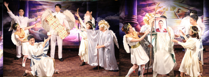
▶ ▲ 眾天使思想神的兒子要以什麼身份降臨人間呢？大能的勇士？享譽世界的音樂家？家財萬貫的國王？