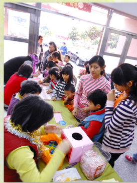
▲ 平和社區居民報到登記並領取抽號碼