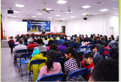
▲ 孩童渴慕聖誕的歡樂