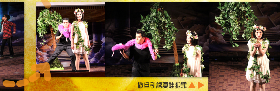
▶ ▲ 撒旦引誘夏娃犯罪 ▶▶