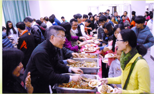
五餅二魚的神蹟，130份餐點供給220人吃飽還有剩餘！