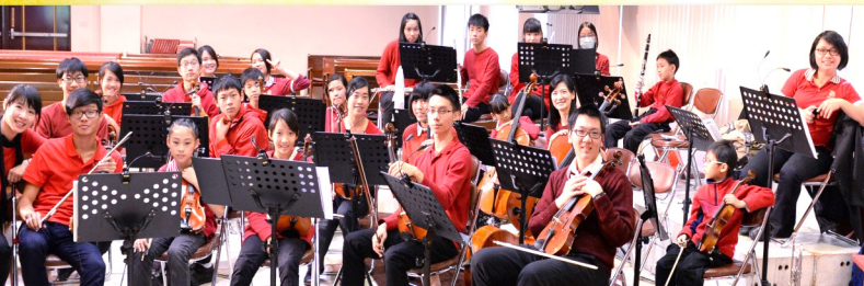
◀ 伴奏的管弦樂團也準備好了