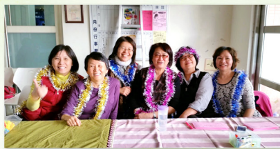
▲ 石牌堂負責接待事工