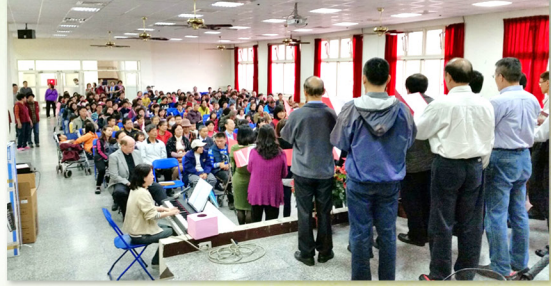
▲ 活水團契獻詩時，會場已經座無虛席了！