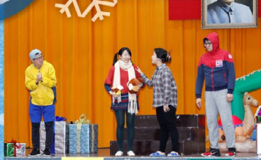
▲ 小雪學習耶穌饒恕人的精神饒恕把她聖誕禮物撕爛的小皮