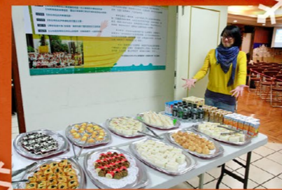
為福音朋友們預備了豐盛美味的餐點