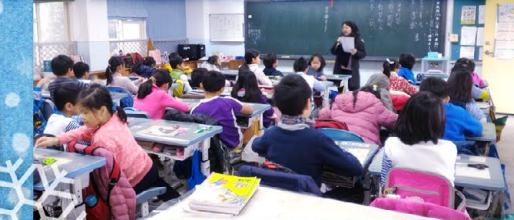
▲ 合班結束後，老師們進班帶活動