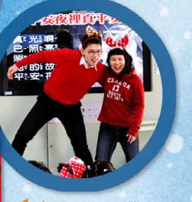
▲ 在哥哥姊帶領下公館國小師生同慶聖誕