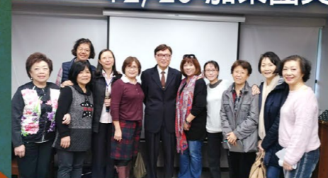
老朋友和新朋友齊聚一堂，為豐盛的飲食獻上感謝