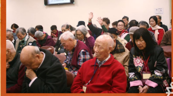
講員信息：「信了就蒙福」