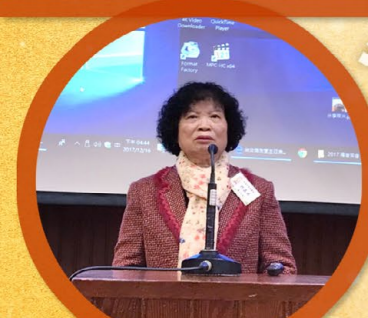
嘉英姊妹生命見證