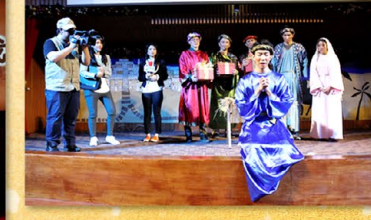
▲ 希律王身邊的阿利接受耶穌作他心中的王