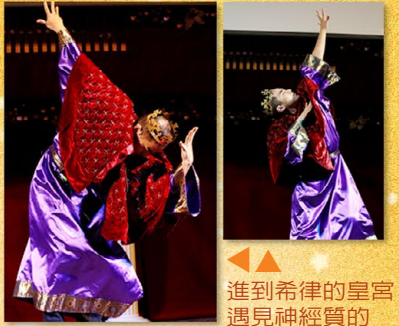
▲ 進到希律的皇宮，遇見神經質的希律王