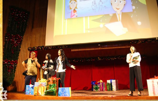
▲ HFPC新聞記者準備到耶穌降生的年代做SNG現場直播