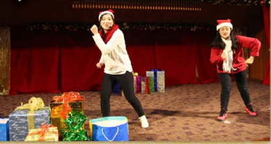
▲ 大家用詩歌慶祝聖誕節