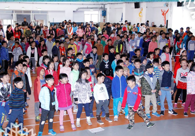
▲ 在哥哥姊姊帶領下銘傳國小師生同慶聖誕