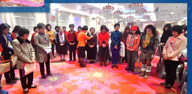
福音餐會前的禱告