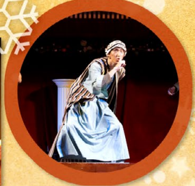
▲ 突然出現的先知西面