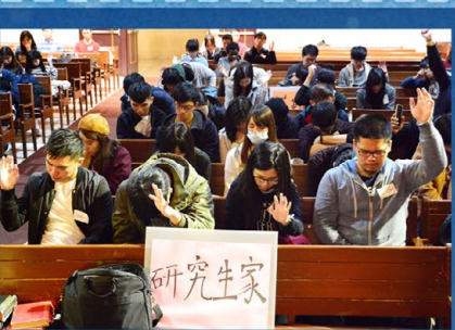
玖玖師母邀請慕道友回應：「是否讓神掌管我們與人之間的關係？」