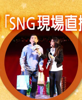
▲ 聖誕節到了，街上都是購物人潮