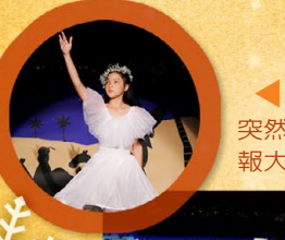
▲ 突然天使來報大好信息