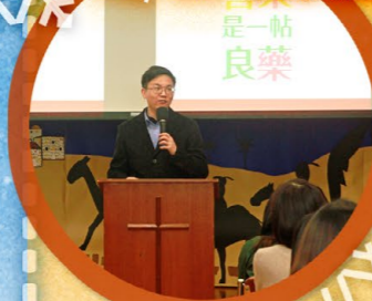
邀請施以諾博士分享聖誕節福音信息