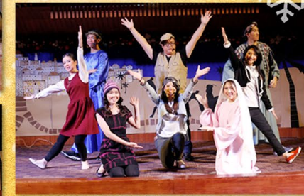
▲ 新聞團隊在傳揚這大好信息中結束現場直播