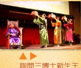
▲ 詢問三博士新生王降生何處