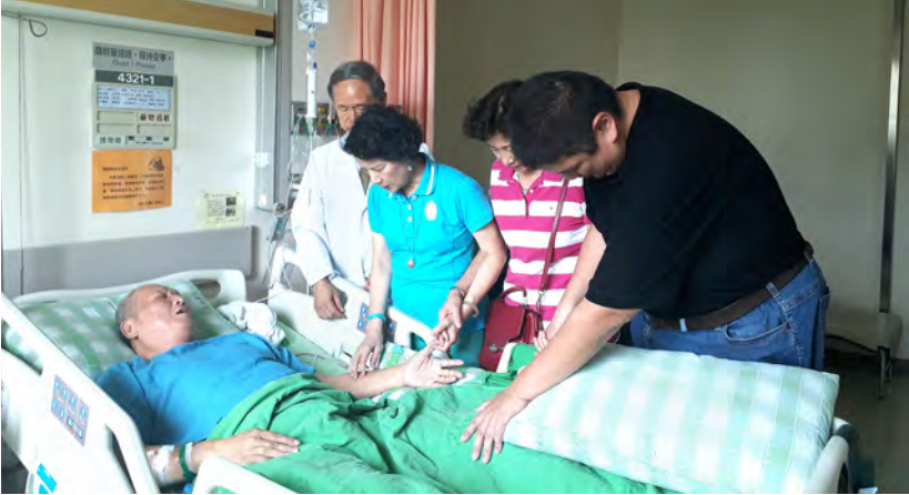
開刀前弟兄姊妹的禱告

友堂大學生的見識和應有的膽識，社青團契讓孩子們看見年輕人工作發揮的細緻和周到，家庭團契讓孩子們看見大人與神關係的穩重和持久；這些才是見證真正的親情之所在，這才是到錫安之家真正可以發現的福音，短宣隊每次來就像一道道的光照進孩子的腦子裡，久而久之才會窩在孩子的心裡。