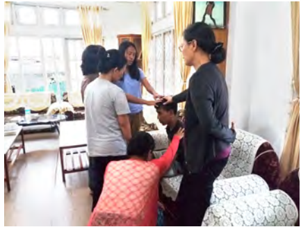
English Bible study group praying for our youth at home.

他自己的壓力及挫折已經滿溢，極度需要安慰、鼓勵及愛，這些使他無法再承受一點從太太來的抱怨。有時婚姻的關係變得僵持，麗娟沒有人可以投訴，缺乏屬靈的餵養，沒有屬靈的同伴，實在孤單。讀了幾本台灣寄來的書，提醒麗娟只能回轉向神，自己裡面的空虛除了神以外，沒有人可以填滿，只有不斷回到主耶穌的恩典及愛中，才能繼續向前。