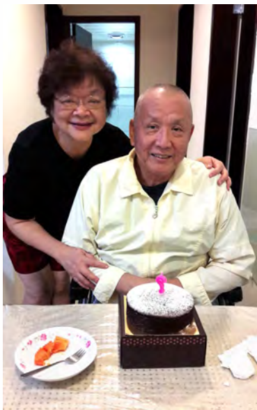
回家後在家過生日

謝謝您持續的代禱和關心；願主記念您為錫安之家和為孩子們的禱告；更願主賜福滿滿給您和全家人。