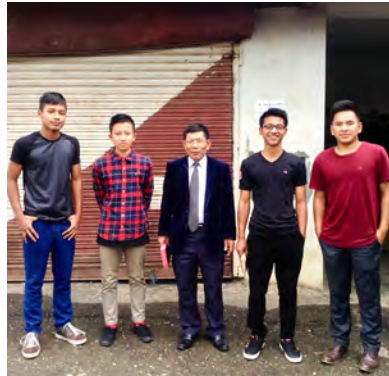
Our Family photo (short of one member: Beichhuakhei)

雖然青少年及學生們的反應都非常好，但是困難及攔阻也從四面八方湧來，似乎教會及學校的領袖們並不太接納我們的事奉，服事青少年的輔導們也很不穩定，很難學習新的事奉方式，醫院的同工也無心延續我們所為他們建立的系統，有時查經班只有兩位參加（我和另一位姊妹），師母禱告會有時也只有兩位（我和另一位癱瘓的師母），因著這諸般的挑戰，有時候實在很想放棄在這裡的事奉，就算做了許多事工，別人也不接受，又或是看不到果效，還能做什麼呢？這樣的心情在今年初算是走到谷底了！