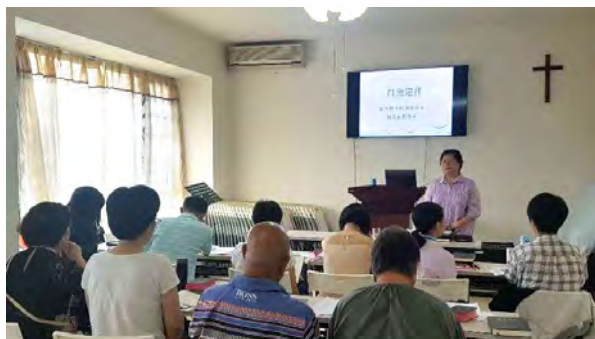
組長培訓，為主委身

特別有一次我的外孫女在孩子們中間精采的分享，令我印象深刻！教會的大學生們去泰北山區學生中心短宣，當時遇到突然來臨的大風，屋頂都快要被吹掉了。在緊急的情況下，大大小小的孩子們依然站在那裡，每個人開口向上帝禱告，單純依靠上帝。這樣的見