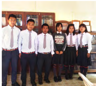
Some students in ECM school whom we provided scholarship.

從去年的短宣隊離開之後，有許多的事工接續而來，我們在教會開始了青少團契，在教會的中學開始像得勝者的課程，在教會的醫院也幫助他們建立藥局的檔案及財務電腦化，幫助兩所教會學校做評鑑的工作，在這些事工進行的過程中，英文查經班及師母的禱告會也繼續進行。