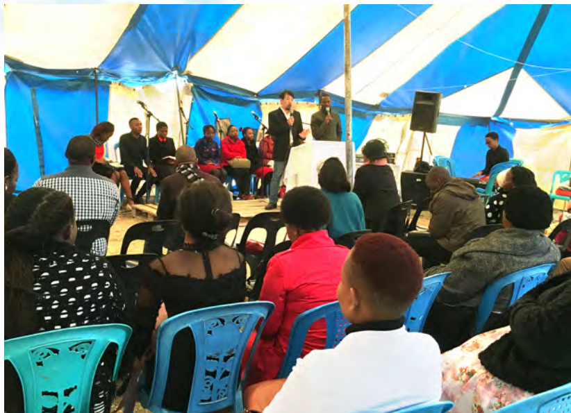
帳棚佈道主日傳講信息