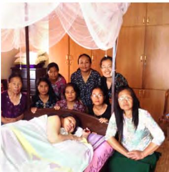
Pastors' wives prayer meeting

有人從台灣寄了《上帝的混沌理論》這本書給我，讓我很受益。我一直以為我可以為神做點大事，我可以在許多方面幫助這地的百姓，不知不覺就帶著優越的態度。神再次提醒我：離了神，我什麼也不能，我和這地的百姓都需要神的恩典和憐憫，我並沒有比他們好。我沒有辦法改變他們，只有神能。我只能不斷連結於神恩典的愛中，才能向別人彰顯出神的恩典及慈愛。在事工到處觸礁的過程中，我才安靜下來，回轉