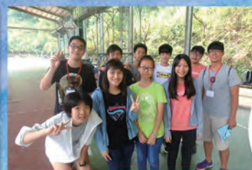
▲ 青少退修會——闖關活動