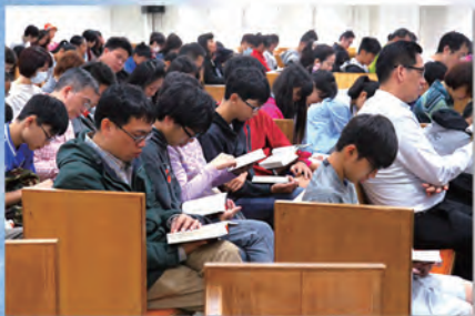
▲ 青少崇拜——親子聖餐主日