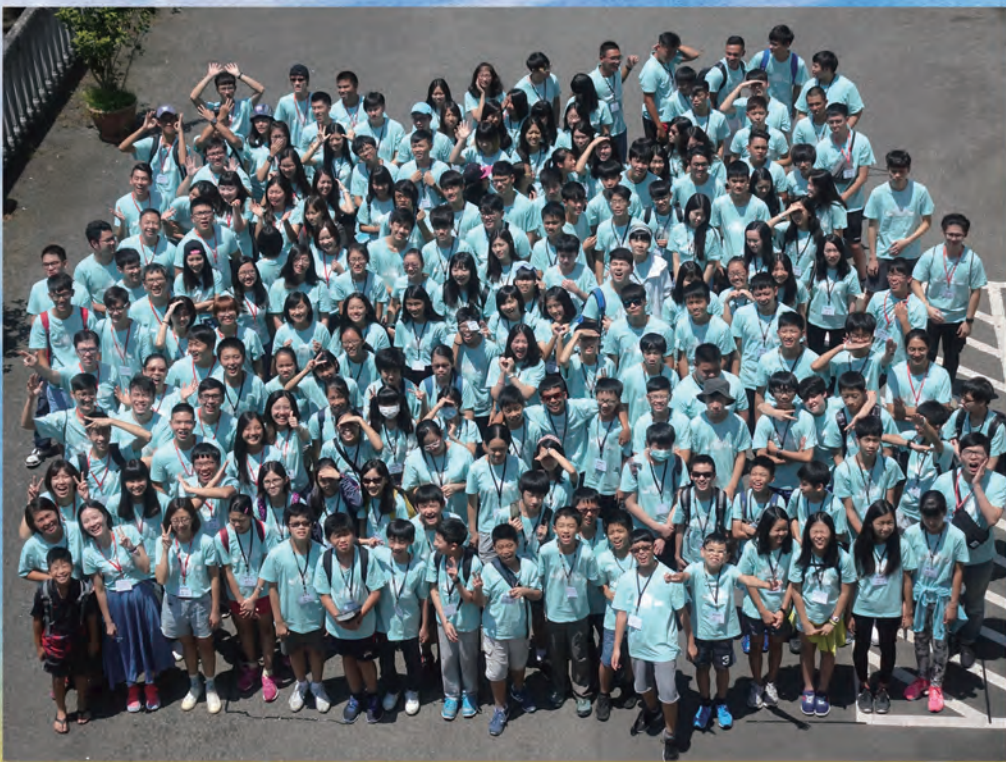
▲ 青少退修會——大合照