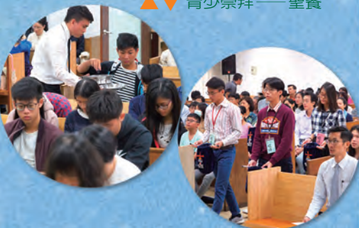
▲ ▼ 青少崇拜——聖餐