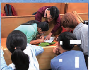
▲ 敬拜小組一同預備