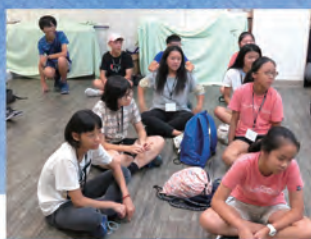
▲ 青少退修會——靜態活動