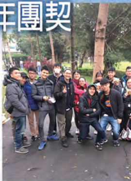
▲ 校園北區高中門徒