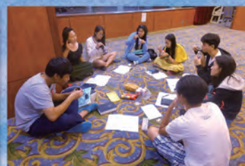
▲ 青少退修會——小組晚禱